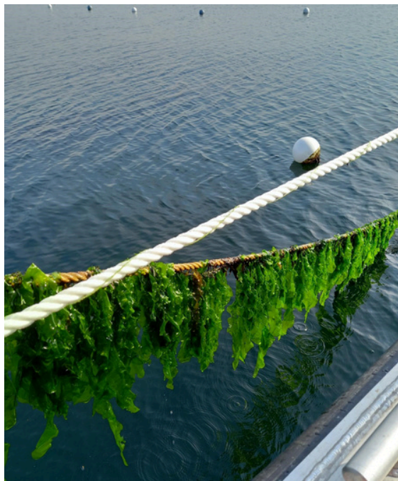
Cc: Nordic SeaFarm

Her kan du lese mer om: ULVA FARM - Large scale sea cultivation of green seaweed .